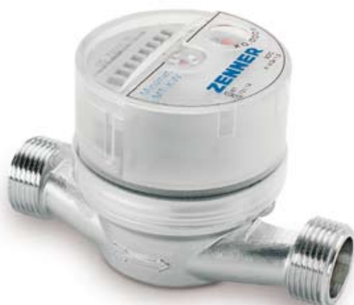
Typischen Wohnungswasserzähler in der Ausführung als Einstrahlzähler und Trockenläufer, bei dem das Flügelrad durch eine Magnetkupplung vom Zählwerk getrennt ist.

ist der Druckanstieg meistens langsam ansteigend, so dass der Wasserzähler den Verbrauch unproblematisch erfassen kann. Bei Toiletten-Druckspülungen wird der zulässige Belastungsbereich eines Standard-Wohnungswasserzählers mit typischerweise 1,5 m 3 /h aber regelmäßig überschritten. Hier werden Durchflüsse