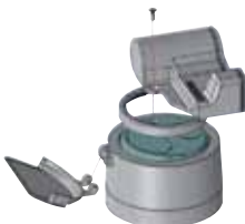
Fig. 4: Mounting of the EDC-C

Place the EDC on the previously cleaned register and fasten it with two fixing screws as shown in picture 5. Then stick the two yellow adhesive security seal stickers over the screws. If necessary the water meter lid has to be changed against the supplied lid which is fitting with the EDC module.