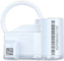
Fig. 2: EDC with fixing clip/screw (EDC-C)

Depending on the register version (standard dry dial or copper-can) two different EDC casing types are available: