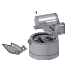
Abb. 5: Montage des EDC-S auf Zähler mit Kupfer/Glas- Zählwerk (IP68)