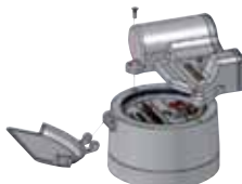
Fig. 5: Mounting of the EDC-S on the copper-can register (IP68)