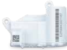
Fig. 3: EDC with fixing screw (EDC-S) for meters with copper-can register (IP68)