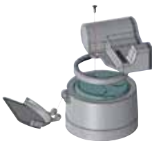
Abb. 4: Montage des EDC-C

Das EDC wie in Abbildung 5 dargestellt auf das ggf. zuvor gereinigte Zählwerk aufsetzen und mit zwei Sicherungsschrauben befestigen. Anschließend die gelben Sicherungsmarken über die Schrauben kleben. Der Wasserzählerdeckel ist ggf. gegen den mitgelieferten Deckel passend zum EDC-Modul auszutauschen.